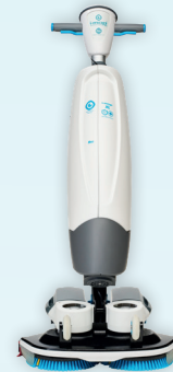
i-mop XL Pro

Inkl. Akku und Ladegerät. Arbeitsbreite: 46 cm Bestell-Nr. I.XL.GTEG