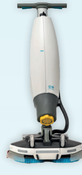
i-mop 40 Pro

Inkl. Akku und Ladegerät. Arbeitsbreite: 40 cm Bestell-Nr. I.40.P.GTEG